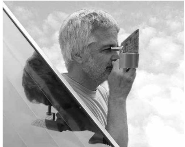
Bild 3 Den zukünftigen Standort der Solaranlage aufsuchen.