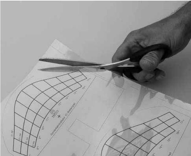
Bild 2 Die zutreffende Sonnenbahnfolie auswählen (51° Brg.= D, 48°-Brg.= D-Süd, Österreich, Schweiz etc.), entlang den dünnen Markierungslinien ausschneiden und in den Edelstahlhalter einschieben.