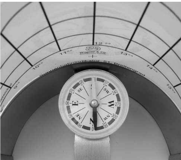
Bild 4 Den Sonnenbahnindikator mit dem Kompass nach Süden ausrichten und dabei möglichst waagrecht halten.